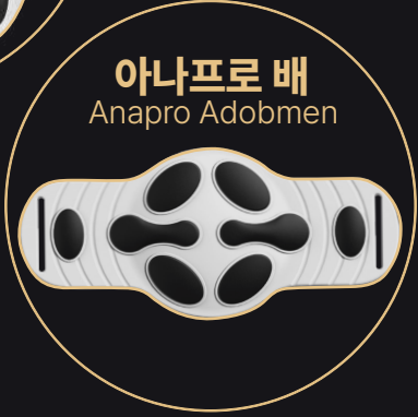
아나프로 배 Anapro Adobmen