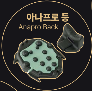
아나프로 등 Anapro Back