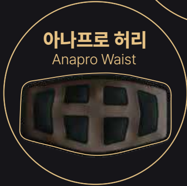
아나프로 허리 Anapro Waist