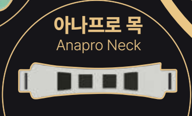
아나프로 목 Anapro Neck