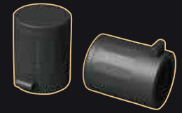
아나프로 부항 Anapro Cupping