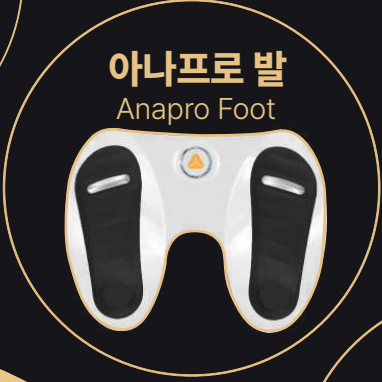
아나프로 발 Anapro Foot