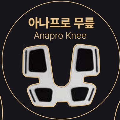
아나프로 무릎 Anapro Knee