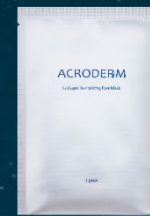
膠原蛋白煥白面膜 (2~3天使用一次)