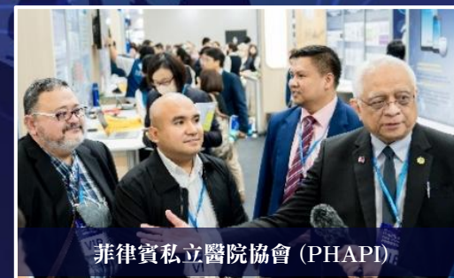
菲律賓私立醫院協會 (PHAPI)