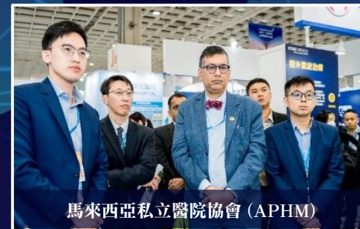
馬來西亞私立醫院協會 (APHM)

Japan Bangladesh Friendship Hospital (JBFH), Dhaka Medical Services Bangladesh Armed Forces Bangladesh Specialised Hospital Ltd, Dhaka