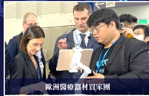
歐洲醫療器材買家團