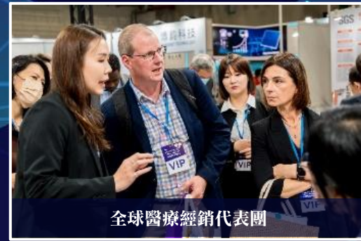
全球醫療經銷代表團