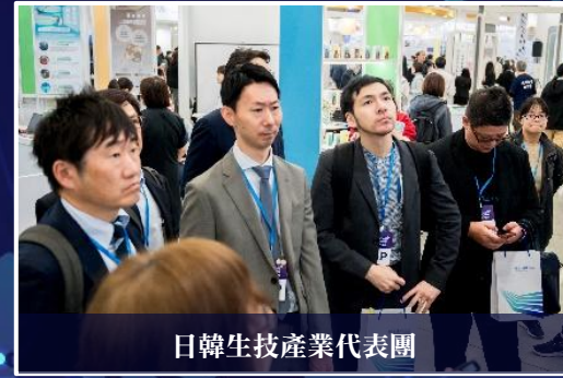
日韓生技產業代表團