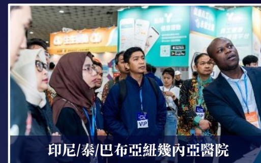
印尼/泰/巴布亞紐幾內亞醫院