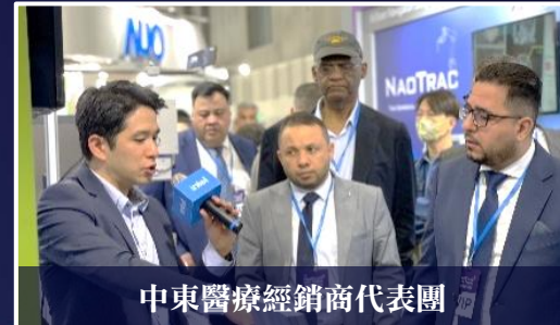
中東醫療經銷商代表團